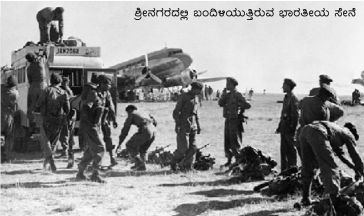
ಶ್ರೀನಗರದಲ್ಲ ಬಂದಿಳಿಯುತ್ತಿರುವ ಭಾರತೀಯ ಸೇನೆ

ಜೂನ್-ಜುಲೈ 1947 ರಲ್ಲಿ ಭಾರತದ ಸ್ವಾತಂತ್ರ್ಯ ಸನ್ನಿಹಿತವಾಗುತ್ತಿದ್ದಾಗ ಒಂದು ಸ್ವತಂತ್ರ ಪ್ರಭುತ್ವವಾಗುವ ಮಹಾರಾಜನ ಬೇಡಿಕೆಯನ್ನು ಅದು ಬೆಂಬಲಿಸಿತು, ಮತ್ತು ಭಾರತಕ್ಕೆ ಸೇರ್ಪಡೆಯಾಗುವುದನ್ನು ವಿರೋಧಿಸಿತು. ಅತ್ತ ಕಣಿವೆಯಲ್ಲಿನ ಕಾಶ್ಮೀರಿಗಳು ಪಾಕಿಸ್ತಾನ-ಬೆಂಬಲಿತ ದಾಳಿಕೋರರನ್ನು ಎದುರಿಸಿ ಹಿಮ್ಮೆಟ್ಟಿಸುತ್ತಿದ್ದಾಗ ಇದರ ಸುಳಿವೇ ಇರಲಿಲ್ಲ. ಇನ್ನೂ ಹೊಲಸು ಸಂಗತಿಯೆಂದರೆ, ಅದು ಕೋಮುವಾದಿ ಉದ್ದೇಶಕ್ಕಾಗಿ ಯುವಜನರಿಗೆ ಶಸ್ತ್ರಗಳನ್ನು ಕೊಟ್ಟು ತರಬೇತಿ ನಡೆಸುತ್ತಿತ್ತು. ಅದರಿಂದಾಗಿ ಇಬ್ಬಾಗವಾದ ಭಾರತ ಹೊತ್ತಿ ಉರಿಯುತ್ತಿದ್ದಾಗ, ಇತ್ತ ಕಾಶ್ಮೀರ ಕಣಿವೆಯಲ್ಲಿ ಮಾತ್ರ ಯಾವುದೇ