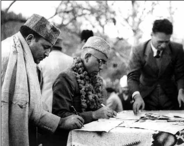
ಶೇಖ್ ಅಬ್ದುಲ್ಲಾ “ಉಳುವವನೇ ಹೊಲದೊಡೆಯ’ ಆದೇಶಕ್ಕೆ ಸಹಿ ಹಾಕುತ್ತಿರುವುದು, ಜುಲೈ 1950

ಇನ್ನೂ ಮಹತ್ವದ ಸಂಗತಿಯೆಂದರೆ, ಭಾರತೀಯ ಸಂವಿಧಾನದಲ್ಲಿರುವ ಎಲ್ಲ ಸ್ವಾತಂತ್ರ್ಯಗಳು, ತಾನು ಆಯ್ದುಕೊಳ್ಳುವ ಯಾವುದೇ ಧರ್ಮವನ್ನು ಆಚರಿಸುವ ಸ್ವಾತಂತ್ರ್ಯವೂ ಕೂಡ ಕಾಶ್ಮೀರದ ಸಂವಿಧಾನದ ಭಾಗವಾಗಿದೆ. ಬೇರೆ ಮಾತುಗಳಲ್ಲಿ ಹೇಳುವುದಾದರೆ, ಈ ಸಂವಿಧಾನ ಒಂದು ಜಾತ್ಯತೀತ ದಸ್ತಾವೇಜು, ಅದು ಮುಸ್ಲಿಂ ಮೂಲಭೂತವಾದವನ್ನು ಅಥವಾ ಪ್ರತ್ಯೇಕತೆಯನ್ನು ಪ್ರೋತ್ಸಾಹಿಸುತ್ತದೆ ಎಂಬ ಅಪಪ್ರಚಾರದಿಂದ ಬಹಳ ದೂರ ಇರುವಂತದ್ದು.